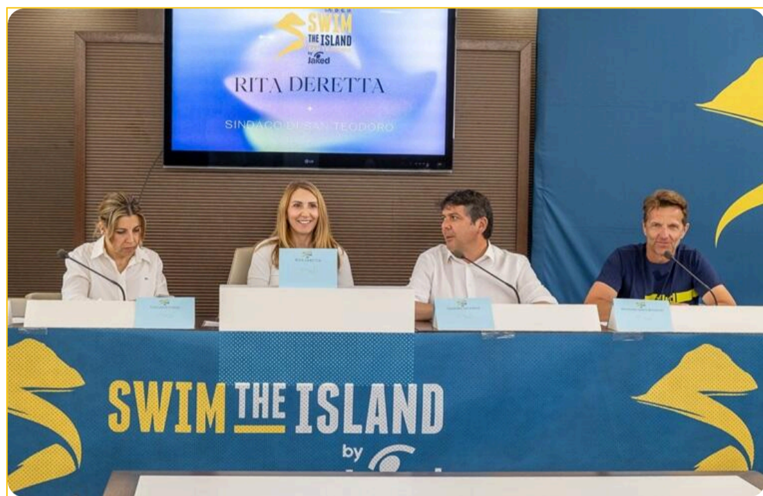
Un momento della conferenza stampa